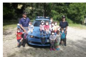
A lezione di mestieri all'agrinido