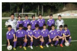
Torneo Cleti, i risultati dei primi incontri