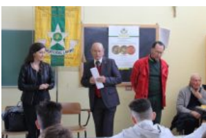
Gli antichi mestieri entrano in classe